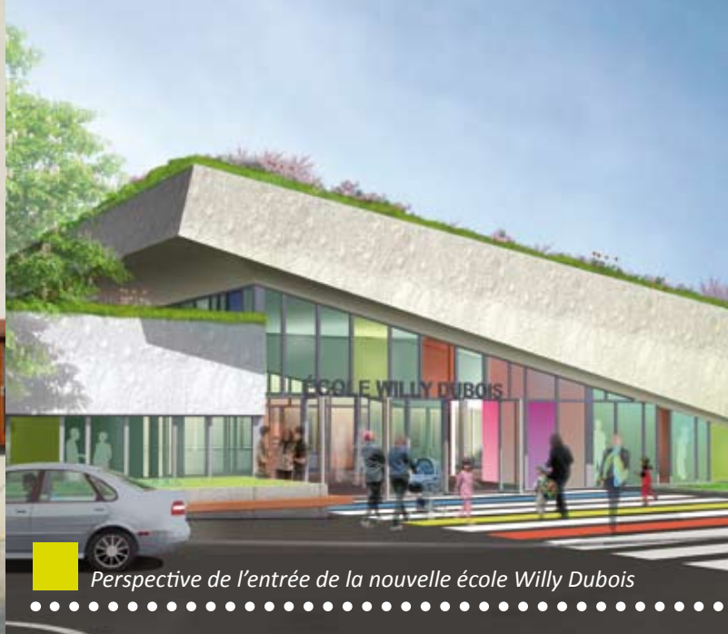
Perspective de l'entrée de la nouvelle école Willy Dubois