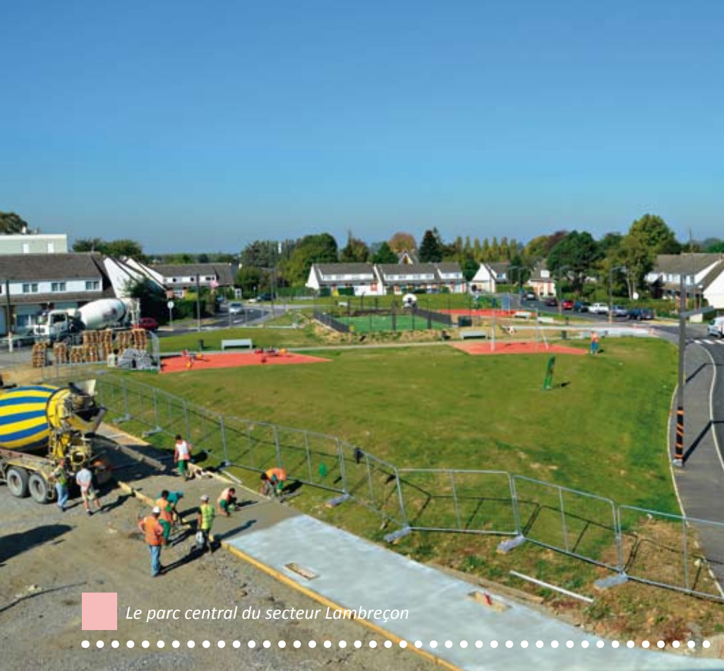
Le parc central du secteur Lambreçon

À notre arrivée, Jeumont était déjà engagée dans le programme de rénovation urbaine.