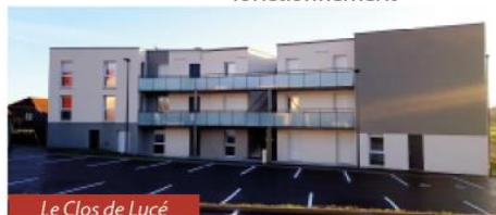
Le Clos de Lucé

Articles L.2313-1du Code Général des Collectivités Territoriales.