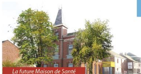
La future Maison de Santé