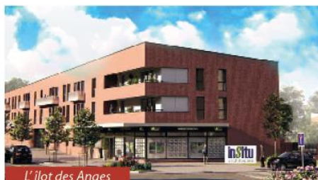
L'îlot des Anges