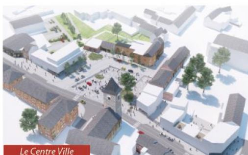
Le Centre Ville