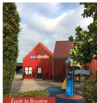
Ecole la Bruyère