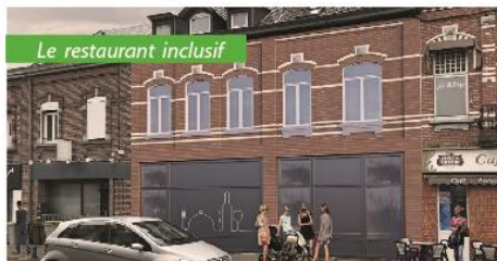
Le restaurant inclusif