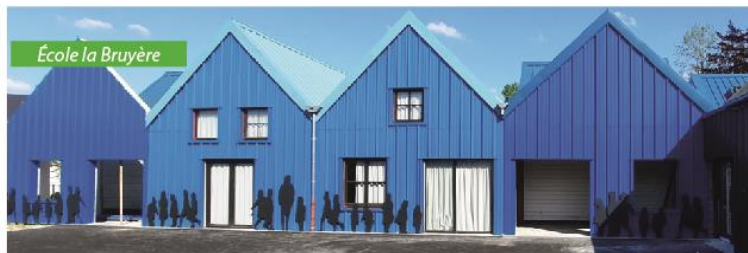
École la Bruyère