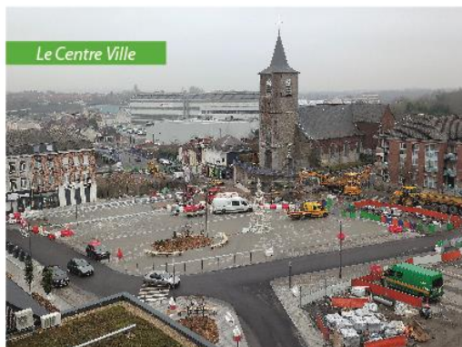
Le Centre Ville