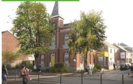
La future Maison de Santé