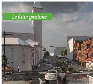
Le futur giratoire