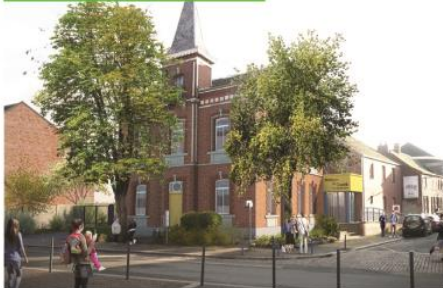
La future Maison de Santé