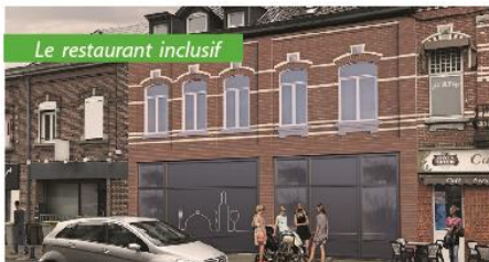
Le restaurant inclusif